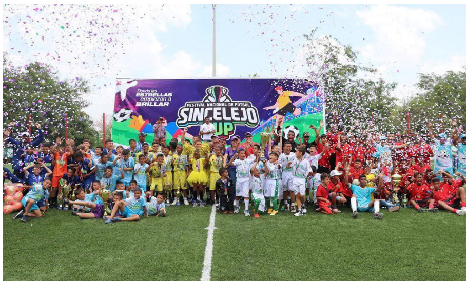
En el torneo participaron alrededor de 106 escuelas