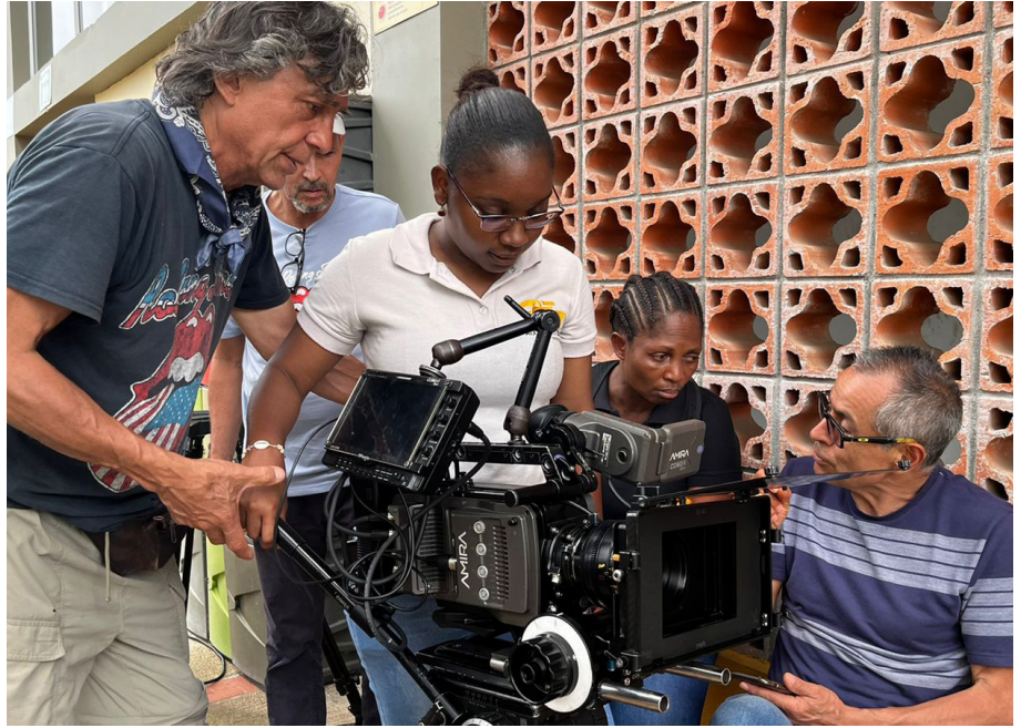
Los jóvenes trabajan de la mano de expertos para crear contenido

Los jóvenes que participan no necesitan tener experiencia en el mundo audiovisual para participar en este proyecto de formación.