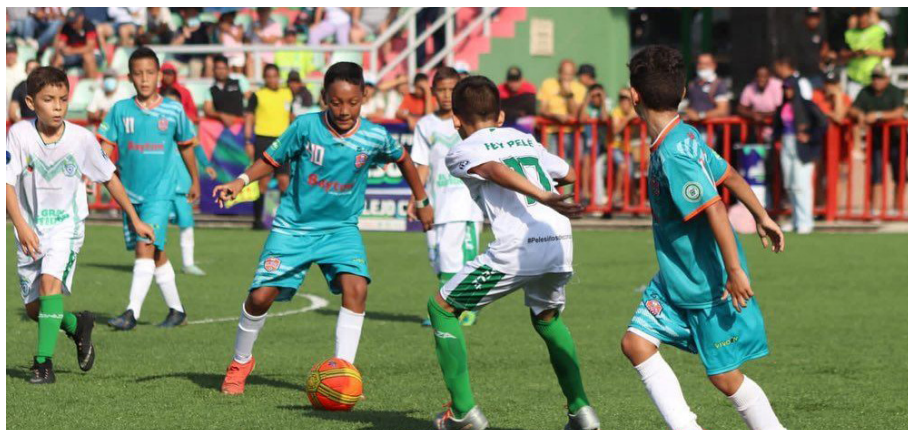
Se jugaron más de 100 partidos durante el torneo

Con estos escenarios, la Alcaldía de Sincelejo y el Inder buscan promover el deporte y la recreación entre los niños.