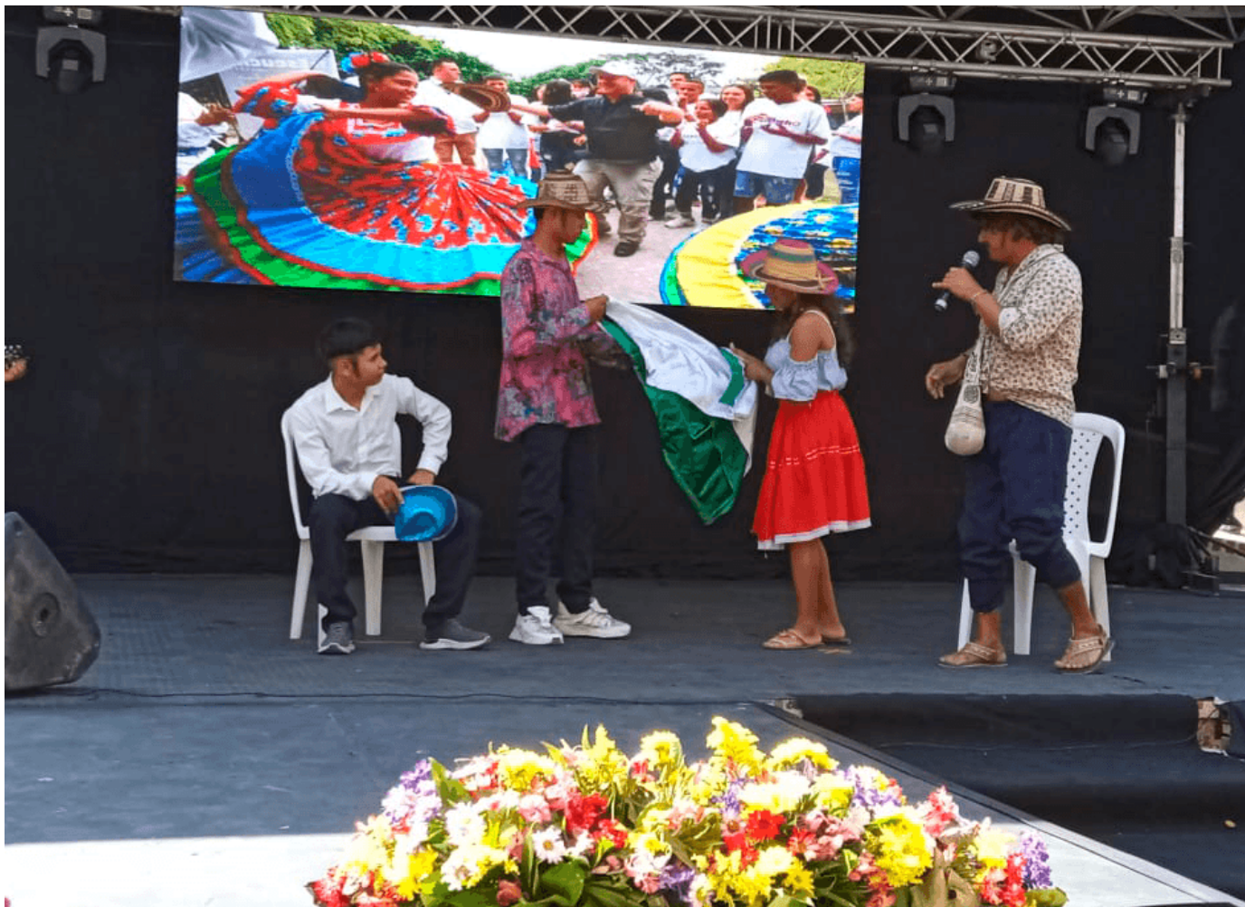
Los integrantes del grupo de teatro Séptimo arte en una de sus presentaciones a nivel local.

La academia cuenta con 24 años de creación