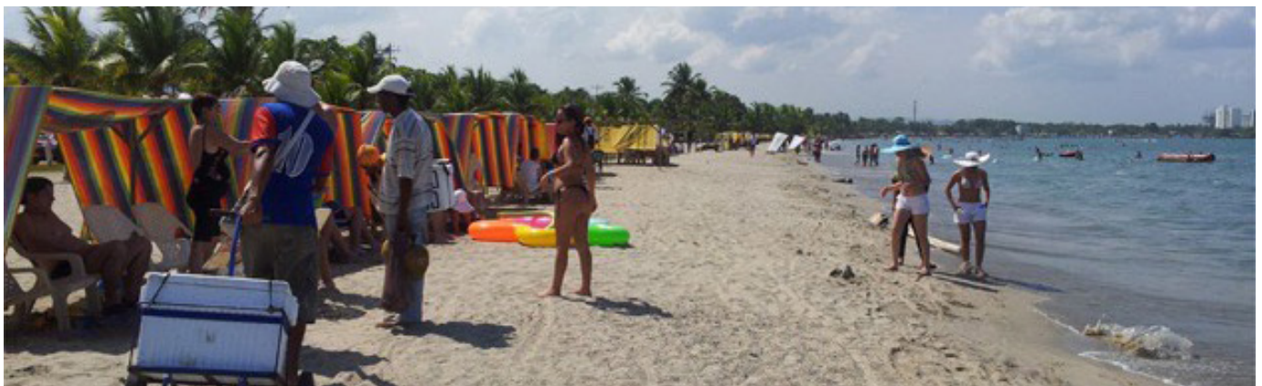
Los principales turistas del golfo de Morrosquillo en Semana Santa fueron locales, según presidente de ASETUR.

“Queríamos que el gobierno lo aumentara gradualmente, pero no fue posible. Creemos que el aumento en las tarifas de energía que están alrededor del 48% para los hoteles y el alza en los productos de la canasta familiar también golpearon fuertemente al turismo”, concluyó.