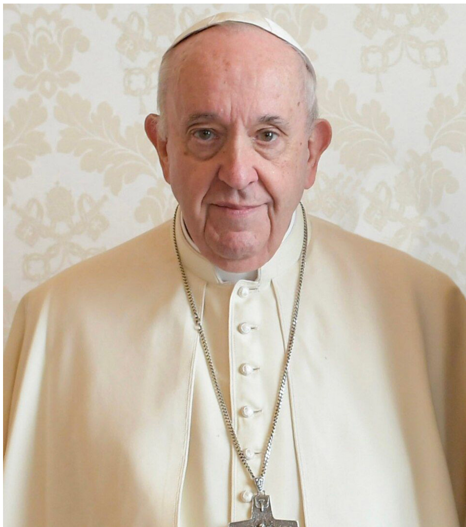
Jorge Mario Bergoglio, antiguo papa católico.

Durante la pandemia de COVID-19, su figura cobró una dimensión global. La imagen del Papa solo, en una Plaza de San Pedro vacía y bajo la lluvia, impartiendo la