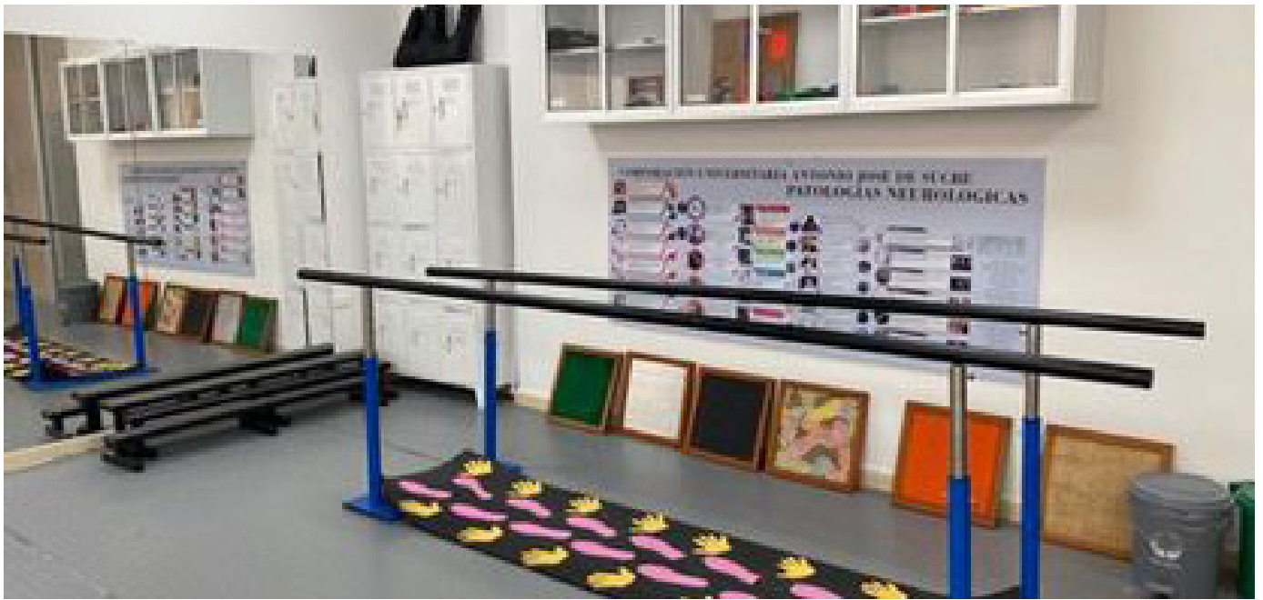
Instalaciones del área de Fisioterapia.