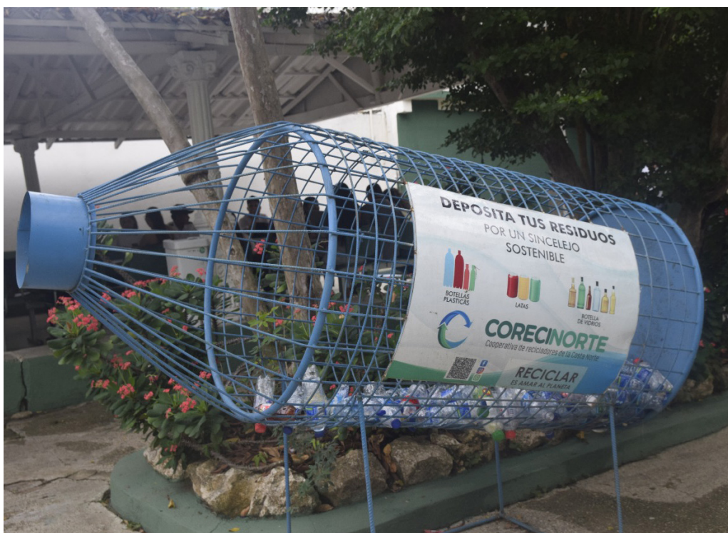
Botella gigante de reciclaje ubicada en sede C

ayudan a propiciar un buen ambiente institucional. Por ello, este programa invita, especialmente a la