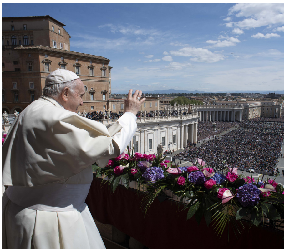
El papa saludando a miles de feligreses en El Vaticano.

Hijo de inmigrantes italianos, Bergoglio creció en un hogar sencillo. Antes de ser sacerdote, estudió química y trabajó brevemente en un laboratorio. Su vocación lo llevó a ingresar a la Compañía de Jesús, una orden religiosa conocida por su compromiso intelectual, su disciplina y su labor en el campo de la educación y la justicia social. Fue ordenado sacerdote en 1969 y más tarde se convirtió en arzobispo de Buenos Aires, donde rápidamente se ganó la reputación de ser un hombre austero, profundamente espiritual y cercano a los más necesitados. Rechazó los privilegios del cargo, vivía en un modesto apartamento, cocina-