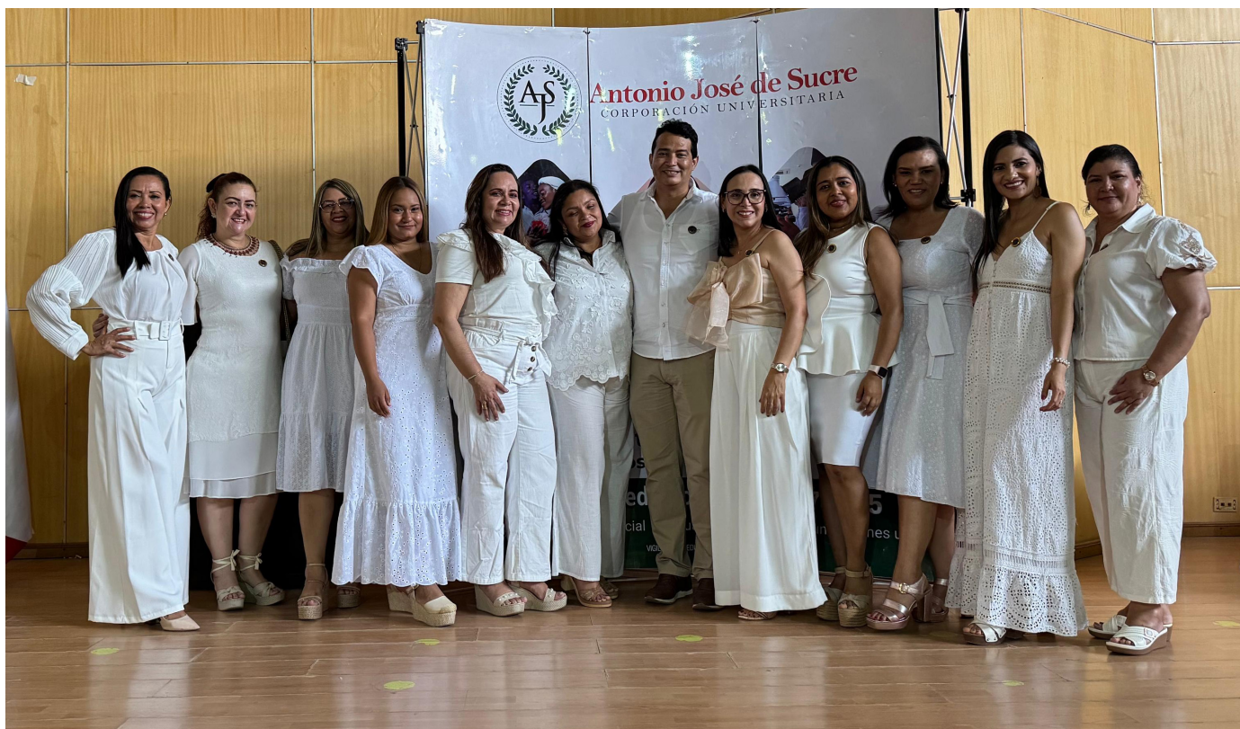
Docentes del programa de Fisioterapia.