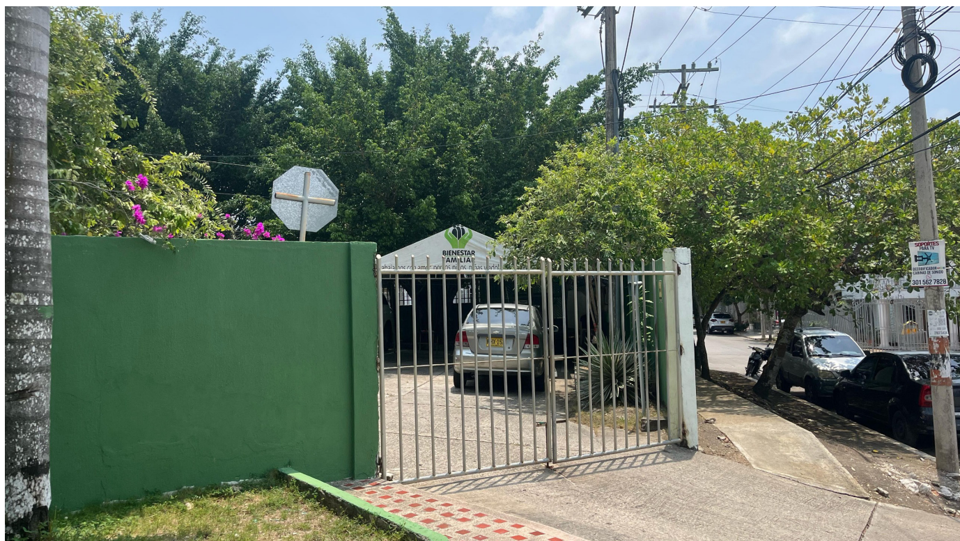
Entrada principal del Instituto Colombiano Bienestar Familiar.

En Sincelejo las Comisarías de Familias y el Bienestar Familiar trabajan en conjunto para reforzar las medidas de protección y prevención a partir de las asistencias legales y psicológicas, con el fin de minimizar la violencia intrafamiliar, siendo esta una problemática que afecta a distintos hogares en la capital sucreña.