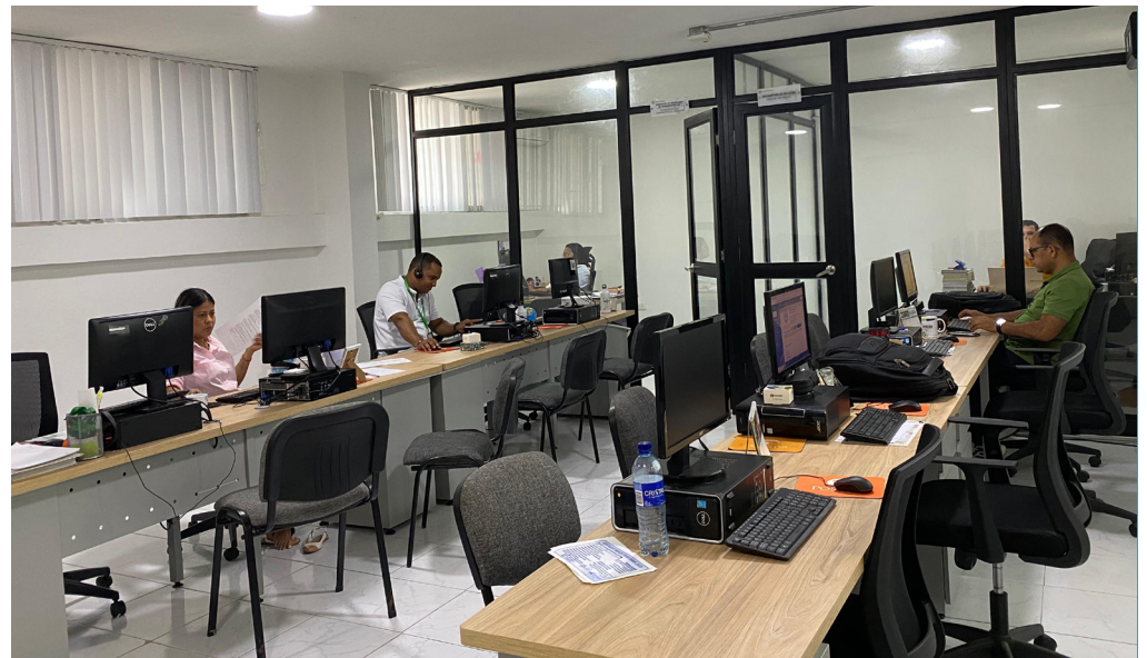
Oficinas de la Facultad de Ciencias Administrativas, Económicas y Contables.

R. Correcto, justamente ahora entró en proceso una estrategia de la DIAN (Dirección de Impuestos y Aduanas Nacionales) que se denomina NAF, esto es un núcleo de apoyo a las empresas, principalmente con fines de formalización, siendo los estudiantes quienes están liderando ese proyecto. De esa forma, la institución y la DIAN están capacitándolos en estos momentos y la idea es que ellos, posteriormente, puedan hacer presencia en muchas empresas para ayudar a formalizar sus actividades en el mercado laboral, a nivel local y departamental. Así que, esa sería gran parte de nuestra labor, impactar en el contexto de mercado a través