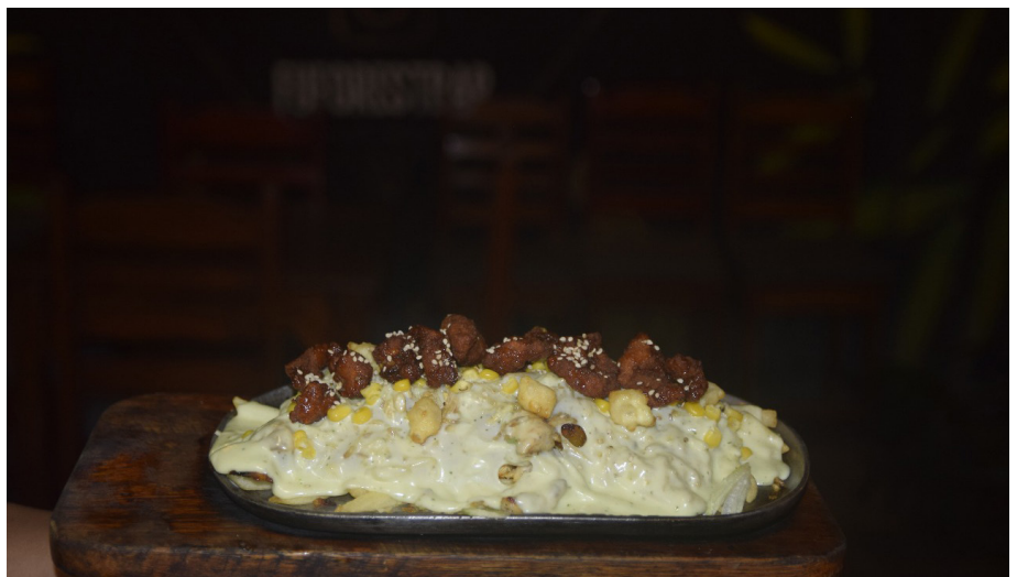
Sabores que unen, momentos que se quedan.

comer, fue una excusa perfecta para compartir, desconectarnos de la rutina y disfrutar de una de las delicias que hacen parte del sabor costeño.